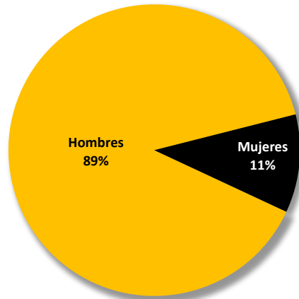
Gráfico No.003 PORCENTAJE DE DEPORTACIONES Y EXPULSIONES POR SEXO: AÑO 2024